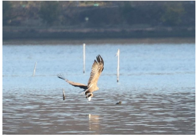
2022.1.8 三方湖で魚を捕獲したオジロワシ